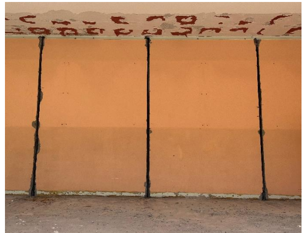
Rainures avec re-bar ancrées