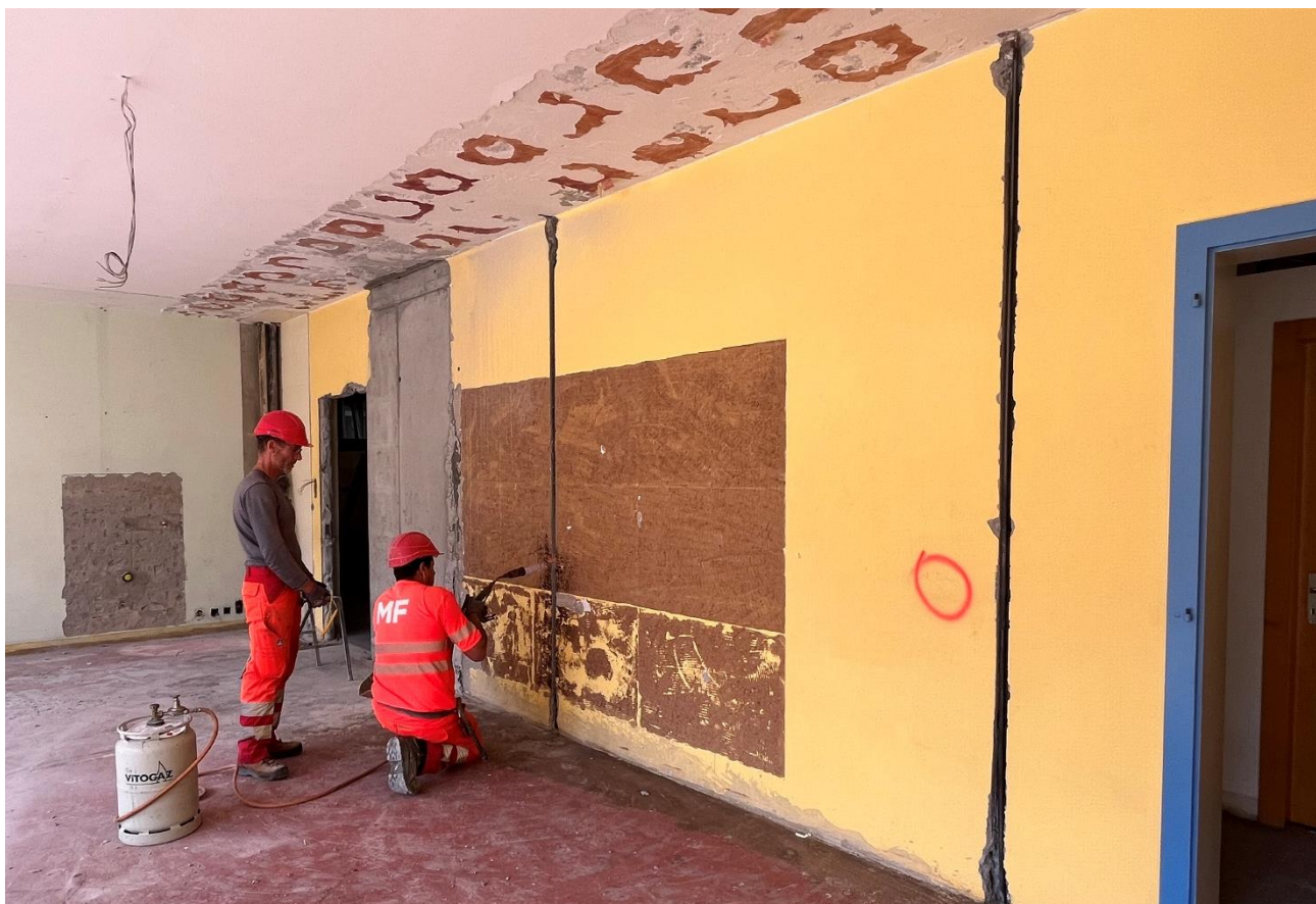
Chauffage des re-bar 16 ancrées