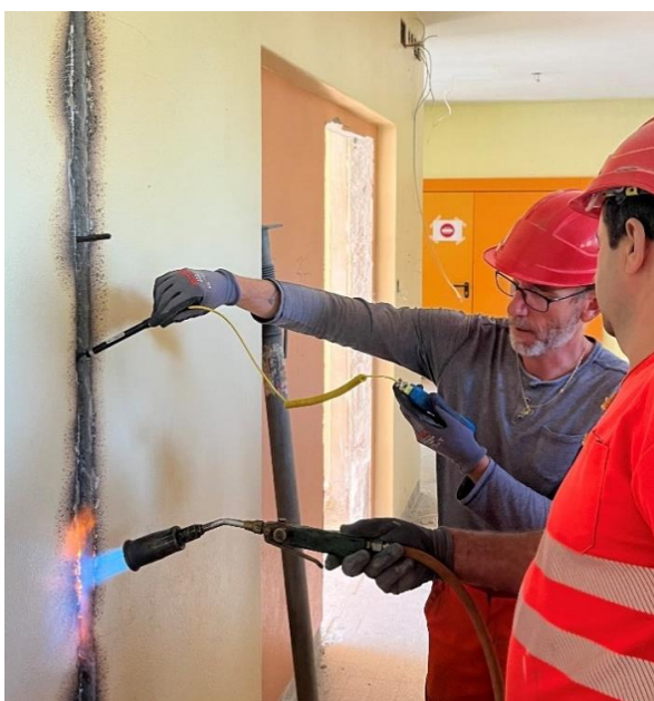
Activation et contrôle de la température