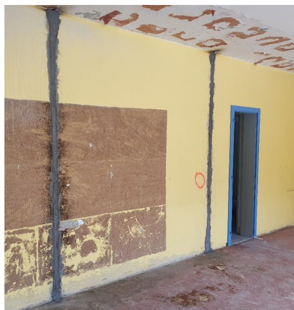
Barres complètement scellées sur toute la hauteur