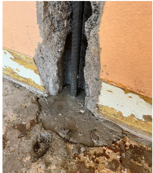
Ancrage avec mortier de re-bar dans la dalle en béton

re-bar est particulièrement intéressant pour ce renforcement de structures. re-bar offre la possibilité de générer une précontrainte de manière ciblée et simple. Il n'est pas nécessaire de recourir à des équipements hydrauliques ni à de grandes préparations de chantier. En l'espace de trois jours de travail, tout était terminé.